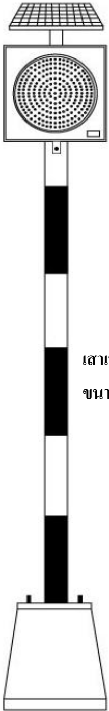
เสาเหล็กทาสีดำสลับขาว ขนาด 4" สูง 3 เมตร